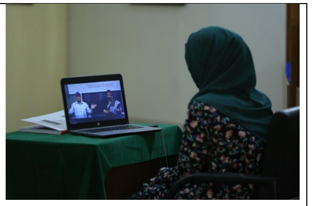
বাক প্রতিবন্ধীদের জন্য ইশারা ভাষার মাধ্যমে খুলনা বিভাগীয় জাদুঘরে তথ্য ভিডিওর মাধ্যমে প্রদর্শন