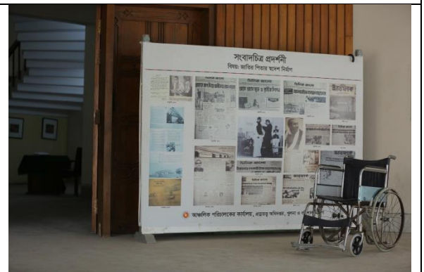
হইল চেয়ারের ব্যবস্থা