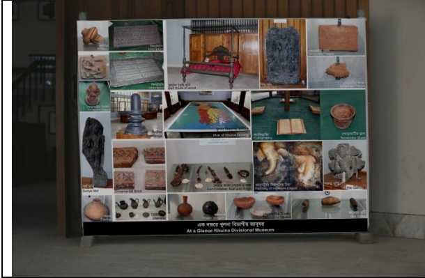
খুলনা বিভাগীয় জাদুঘরের তথ্য সম্বলিত ব্যানার স্থাপন