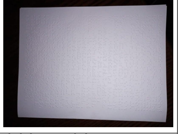
দৃষ্টি প্রতিবন্ধীদের জন্য খুলনা বিভাগীয় জাদুঘরের তথ্য ব্রেইল (Braille) পদ্ধতিতে সংরক্ষণ

৪. দৃষ্টি প্রতিবন্ধীদের জন্য খুলনা বিভাগীয় জাদুঘরের তথ্য রেকর্ড করে হেড ফোনের মাধ্যমে শোনার ব্যবস্থা করা হয়েছে। যা অভ্যর্থনাকেন্দ্রে রাখার ব্যবস্থা করা হয়েছে।