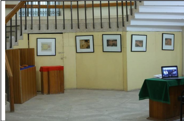
সাম্প্রতিক প্রহৃত্ত্বাত্মিক খননে প্রাপ্ত প্রহৃত্ত্ব/ নিদর্শনের আলোকচিত্র

(খ) প্রহৃত্ত্বের অনুকৃতি (Replica) প্রদর্শিত হয়েছে।