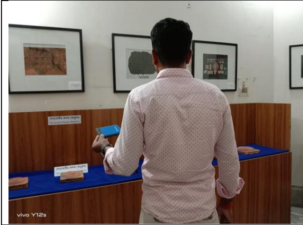
দৃষ্টি প্রতিবন্ধীদের জন্য খুলনা বিভাগীয় জাদুঘরের তথ্য রেকর্ড করে হেড ফোনের মাধ্যমে শোনার ব্যবস্থা

৪. দৃষ্টি প্রতিবন্ধীদের জন্য খুলনা বিভাগীয় জাদুঘরের তথ্য রেকর্ড করে হেড ফোনের মাধ্যমে শোনার ব্যবস্থা করা হয়েছে। যা অভ্যর্থনাকেন্দ্রে রাখার ব্যবস্থা করা হয়েছে।