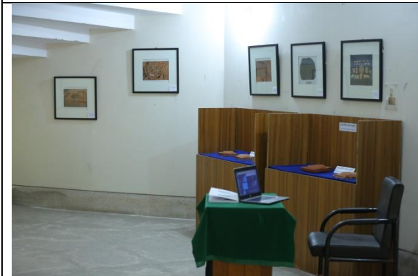
সাম্প্রতিক প্রহৃত্ত্বাত্মিক খননে প্রাপ্ত প্রহৃত্ত্ব/ নিদর্শনের আলোকচিত্র