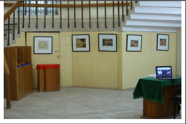
সাম্প্রতিক প্রহৃত্ত্বাত্মিক খননে প্রাপ্ত প্রহৃত্ত্ব/ নিদর্শনের আলোকচিত্র