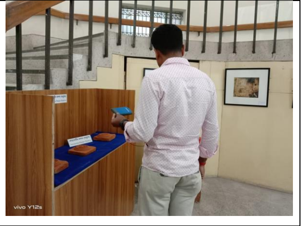
দৃষ্টি প্রতিবন্ধীদের জন্য খুলনা বিভাগীয় জাদুঘরের তথ্য রেকর্ড করে হেড ফোনের মাধ্যমে শোনার ব্যবস্থা

৫. বাক প্রতিবন্ধীদের জন্য ইশারা ভাষার (Sine Language) মাধ্যমে খুলনা বিভাগীয় জাদুঘরে তথ্য ভিডিওর মাধ্যমে প্রদর্শন করা হয়েছে।