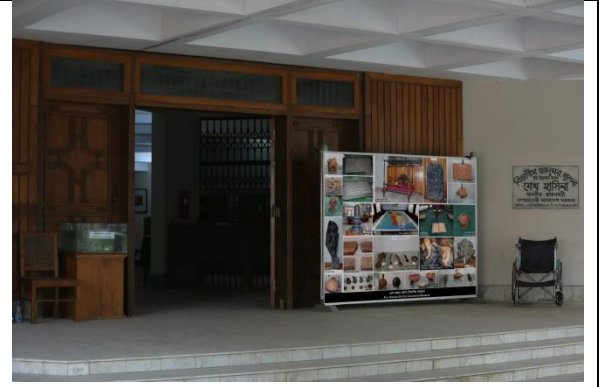
খুলনা বিভাগীয় জাদুঘরের তথ্য সম্বলিত ব্যানার স্থাপন