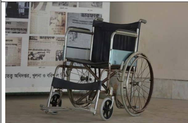
হইল চেয়ারের ব্যবস্থা