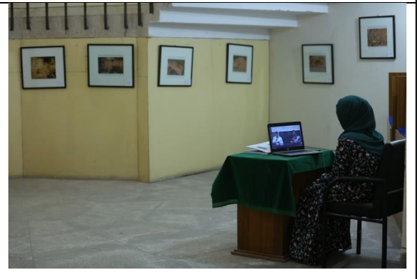
সাম্প্রতিক প্রহৃত্ত্বাত্মিক খননে প্রাপ্ত প্রহৃত্ত্ব/ নিদর্শনের আলোকচিত্র