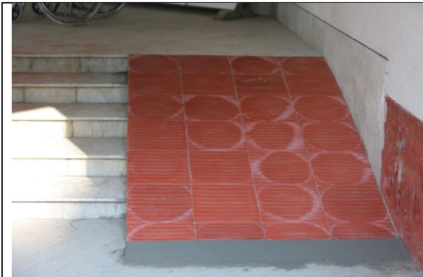
শারীরিক প্রতিবন্ধীদের জন্য র‍্যাম্প স্থাপন