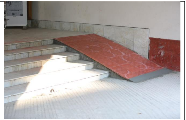
শারীরিক প্রতিবন্ধীদের জন্য র‍্যাম্প স্থাপন