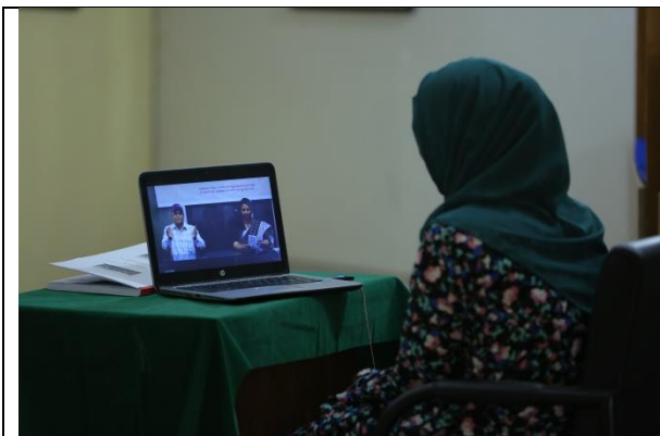
বাক প্রতিবন্ধীদের জন্য ইশারা ভাষার মাধ্যমে খুলনা বিভাগীয় জাদুঘরে তথ্য ভিডিওর মাধ্যমে প্রদর্শন

৫. বাক প্রতিবন্ধীদের জন্য ইশারা ভাষার (Sine Language) মাধ্যমে খুলনা বিভাগীয় জাদুঘরে তথ্য ভিডিওর মাধ্যমে প্রদর্শন করা হয়েছে।